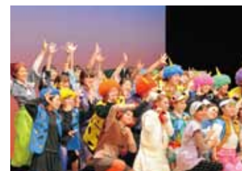
「こどものための音楽会」フィナーレ 幼児教育学科