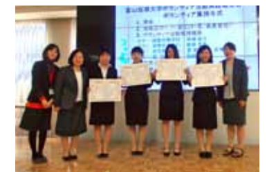
「ボランティア表彰」 プレゼンテーションスタジオ