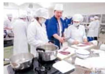
「魚のさばき方講習会」 食物栄養学科