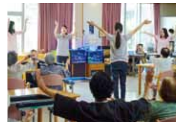
「老人ホームで健康体操」 福祉学科