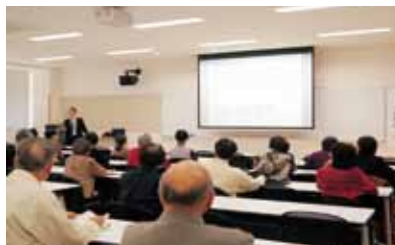
「富山の魅力・再発見」 創立50周年記念事業公開講座