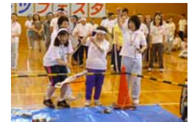
「スポーツフェスタ」 障害者福祉施設