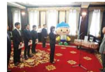
「全国豊かな海づくり大会交付式」 富山県庁