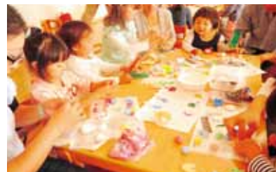
「親子で楽しむ造形」 付属みどり野幼稚園公開講座