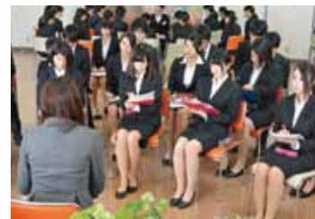
「就活キックオフ!集中セミナー」 経営情報学科