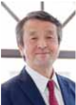
三上 雅弘 教授